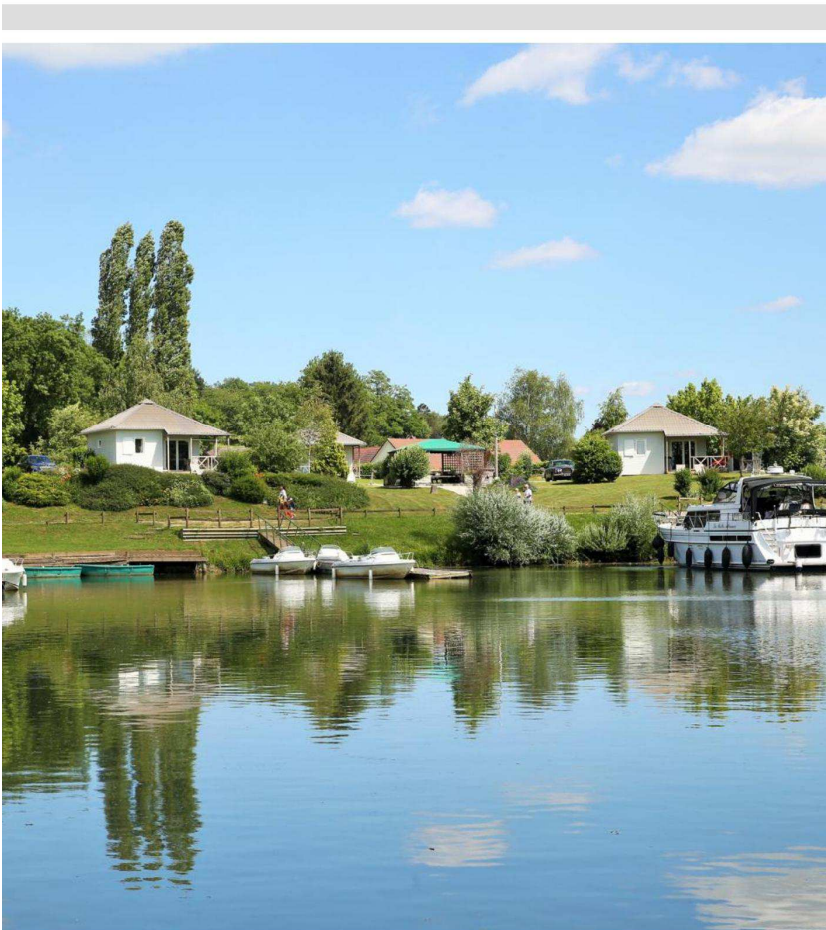
Le parc de loisirs Saône Valley à Traves abrite 10 chalets et désormais un lodge flottant. Les visiteurs peuvent se divertir ou pêcher grâce à la Saône qui passe en son sein.